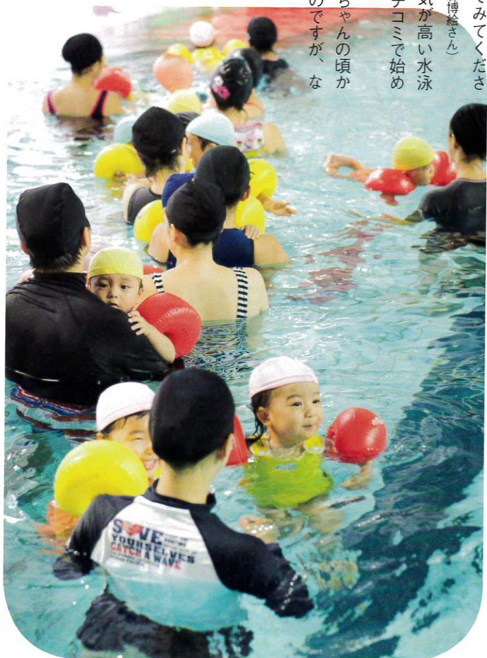
子どもたちに人気は滑り台。ママやパパにめがけてジャンプ！

①生後6カ月～3歳未満②月曜・火曜10:10～11:00、土曜・日曜13:00～13:50③月会費7500円、入会金5000円、ほか事務手数料、水着代など別途④東京都渋谷区笹塚1-50-1⑤03-3481-5866 http://nacs.co.jp/